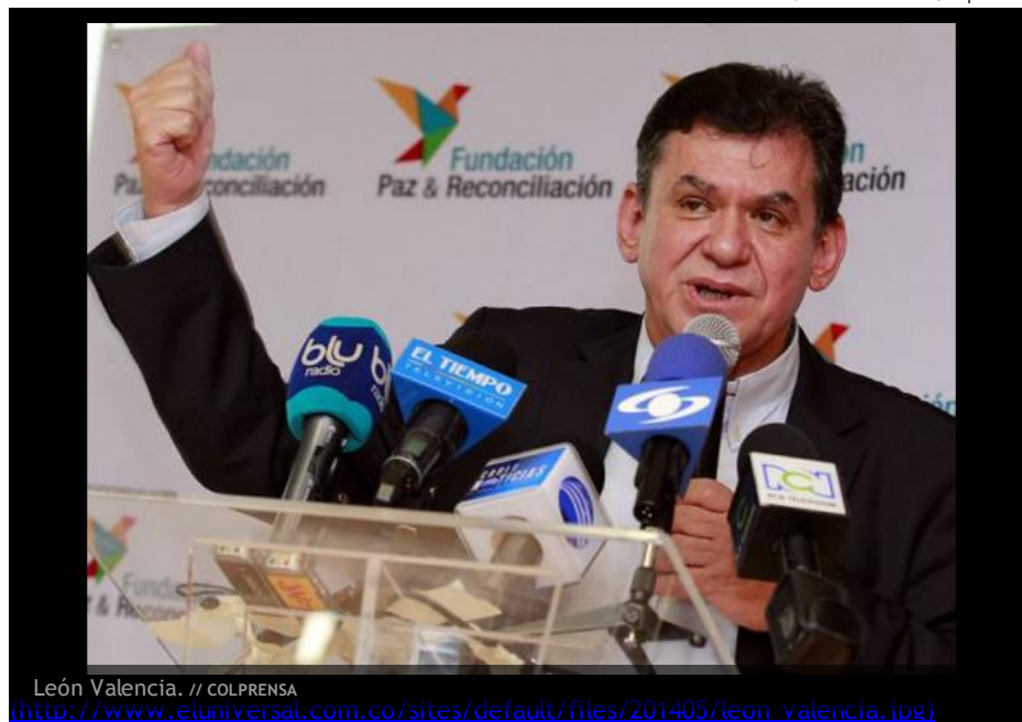
León Valencia.

COLPRENSA | @ElUniversalCtg (https://twitter.com/ElUniversalCtg) | BOGOTÁ | 16 de Mayo de 2014 06:56 pm |